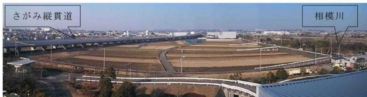
建設予定地の写真（厚木市環境センターから撮影）