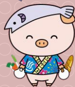
厚木市マスコットキャラクター